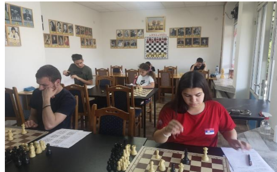
Лесковац и Нови Бановци